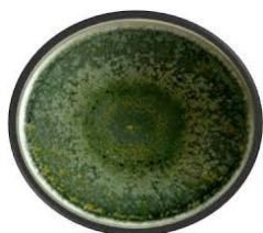
Aspecto de T. harzianum creciendo en el medio de cultivo PDA.

Debido a que las esporas de TRICOBIOIOL® no requieren un reconocimiento específico para colonizar la rizosfera o raíces de las plantas, pueden tener efectos benéficos generalizados en prácticamente todas las plantas cultivadas. De esta forma se han visto efectos en plantas tan diversas como banano, mango, aguacate, guanábana, café, pinos, maracuyá, entre otras.